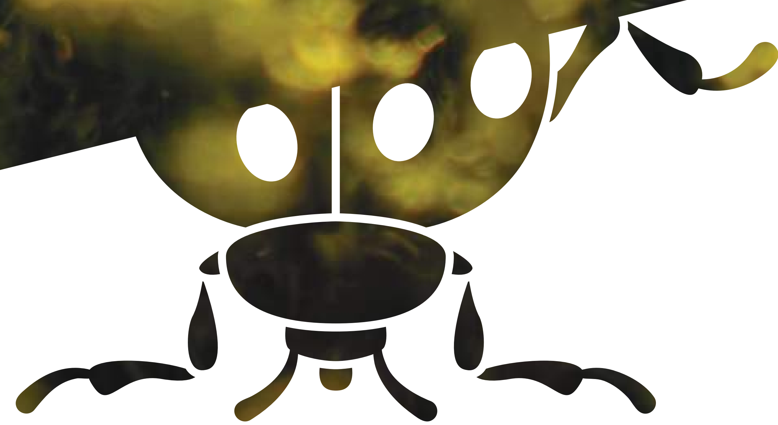
Coccinelle à sept points

La biodiversité, c'est toute la richesse de la vie sur Terre. Ce sont les animaux, les végétaux, les champignons, les bactéries et tous les autres êtres vivants de notre planète. Les êtres humains en font aussi partie. Nous avons tous besoin les uns des autres pour vivre. La biodiversité c'est aussi ces liens qui nous unissent !